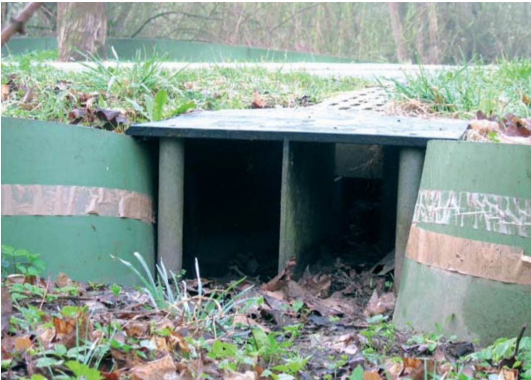
Eén van de twee paddentunnels (onder 't Laantje) is inmiddels gerealiseerd.