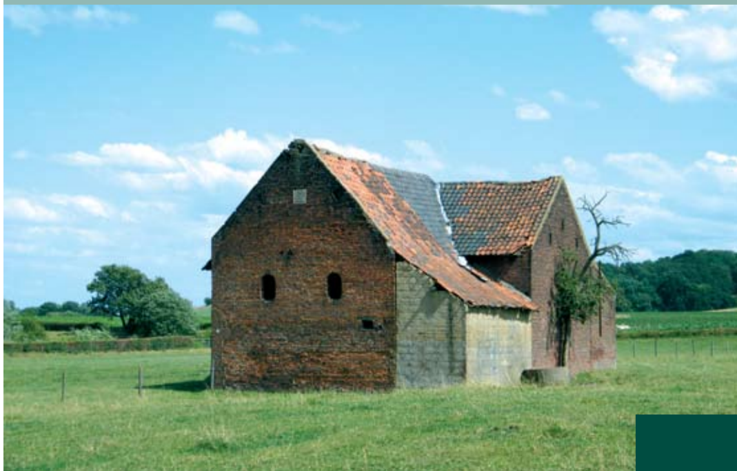
De Oude Pastorie is een belangrijk groenproject van de gemeente Beek.

Een ander omvangrijk, gemeentegrensoverschrijdend, groenproject vormt de landschappelijke opwaardering van de hellingen Spaubeek-Schinnen. Als highlight 15 vormt dit een onderdeel van Corio Glana. De opwaardering moet resulteren in de realisatie van een ecologische verbindingzone. De visie is klaar. Het oog wil ook wat, daarom proberen we vanuit de dorpsrand van Spaubeek meer zicht op de hellingen en het Hoogbeekske te creëren. Verder is ons streven om ook de groeven tussen Schinnen en Spaubeek in dit project te integreren.“