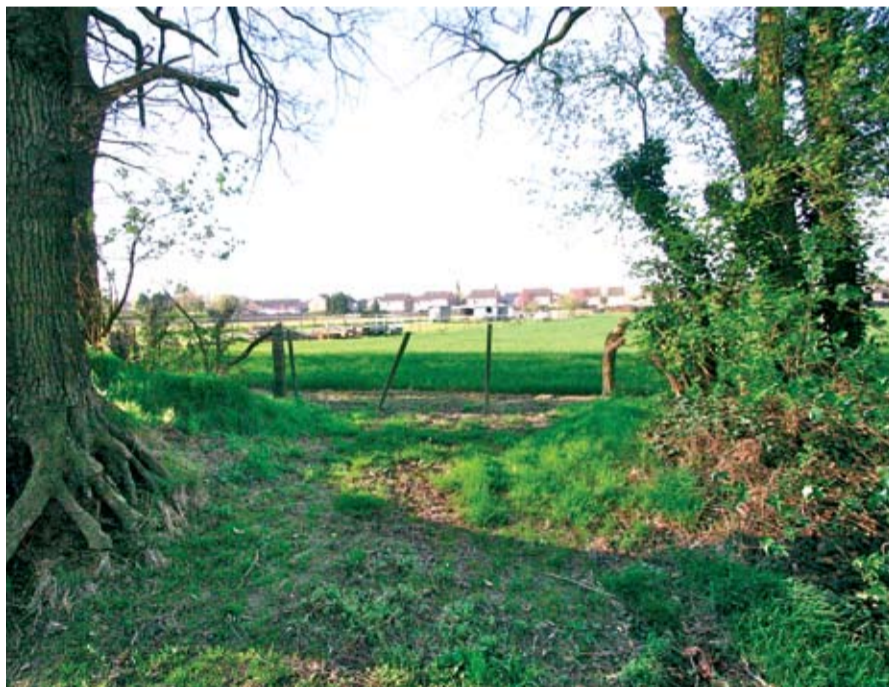
Verfraaiing van het landschap en uitbreiding van de recreatieve mogelijkheden gaan het Heidekampspark tot een aantrekkelijk uitlooppgebied maken.