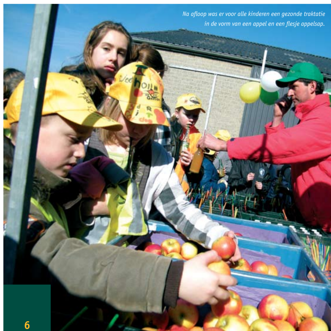
Na afloop was er voor alle kinderen een gezonde traktatie in de vorm van een appel en een flesje appelsap.