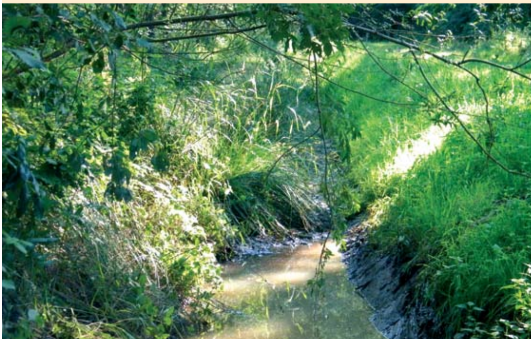
De Kakkert gaat weer meanderen.

„De toeloop van de recreatieve wandelroutes richting Sweikhuizen is buitengewoon groot. Dit succes heeft ook zijn keerzijde. Tijdens piekmomenten zorgt dit voor parkeeroverlast bij met name Gasterij De Bokkereyer. In overleg met de ondernemer en de buurt willen we dit oplossen middels de aanleg van een transferium met een capaciteit van circa 30 auto's. De precieze plek hiervan moeten we nog bepalen. Verder willen we de toeloop naar ons gebied meer over de gemeente spreiden. Er zijn veel meer mooie plekken en pleisterplaatsen van waaruit fietsers en wandelaars kunnen starten.“