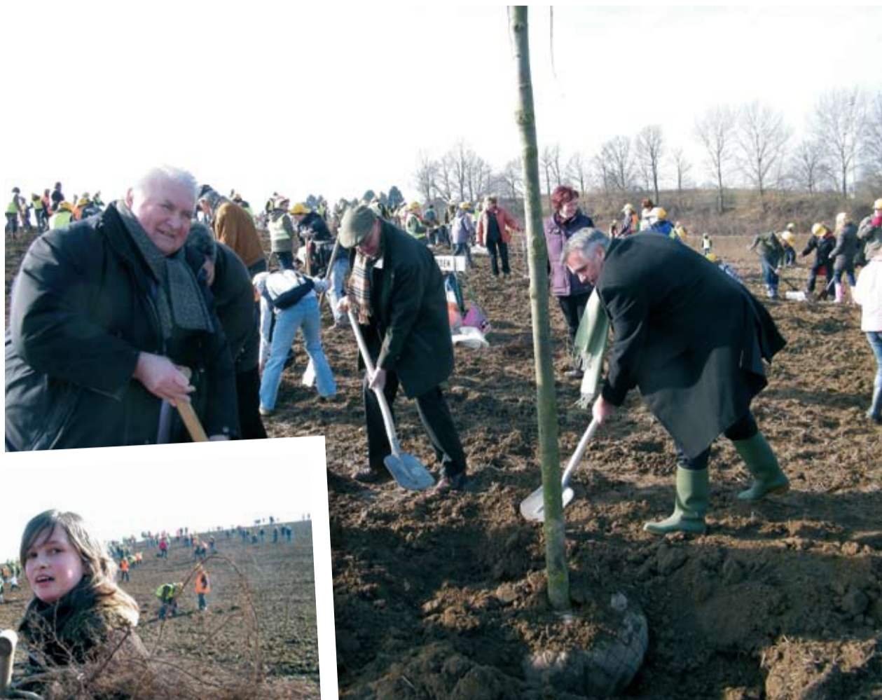
Naast de kinderen staken tijdens de Boomfeestdag op de Windraak ook vertegenwoordigers van de gemeenten Schinnen en Sittard-Geleen, Rabobank Westelijke Mijnstreek en Landschapspark De Graven de handen uit de mouwen.

De Boomfeestdag werd dit jaar mede mogelijk gemaakt door financiële bijdrages van de provincie Limburg in het kader van Vitaal Platteland en de Rabobank Westelijke Mijnstreek. Bovendien zou zonder de inzet van een leger vrijwilligers, zowel tijdens de voorbereiding als tijdens de plantdagen, het evenement niet tot stand kunnen komen.