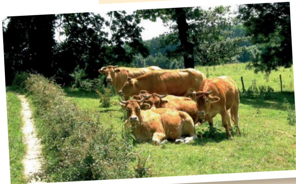
De op één na mooiste foto van Piet Penders: „Rusten aan het wandelpad in Sweikhuizen.“