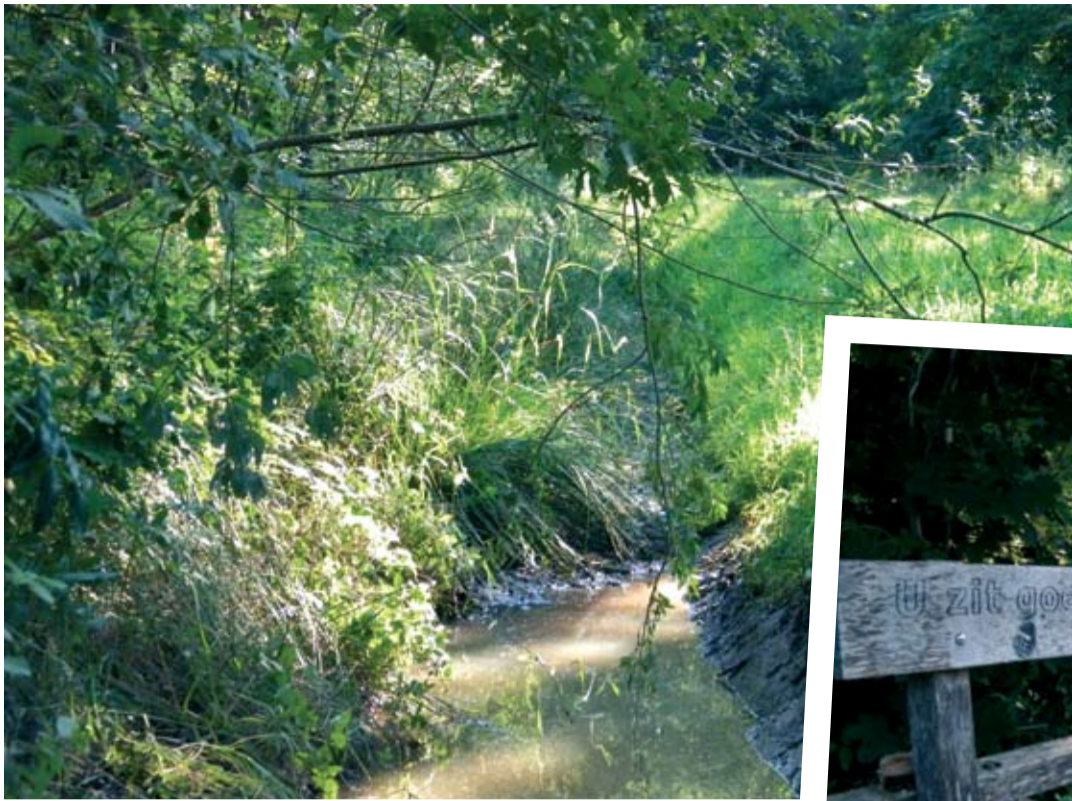
De Kakkert kent diverse bronnen.