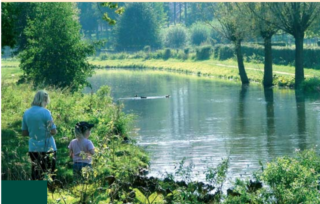
De afwisseling van nieuw bos en akkers zorgt voor een mooi afwisselend landschap in het Absbroekbos.

„Alle gemeenten hangen de komende jaren forse kortingen op het gemeentelijk budget boven het hoofd. Natuurprojecten zullen aan de bezuinigingslans niet ontkomen. Economisch gezien kost natuur alleen maar geld en levert niets op. Echter water en natuur trekken mensen aan. Het zijn plekken waar je los komt van de dagelijkse besommeringen. Het ontspant en versterkt hart en geest. Daarmee zorgt de natuur voor een onbetaalbare schat die we moeten koesteren voor ons zelf, maar zeer zeker ook voor de generaties die na ons komen. Gelukkig hebben de gemeenten Schinnen, Beek, Stein en Sittard-Geleen elkaar gevonden wat betreft de uitvoering van natuurprojecten zoals die in de Regiovisie zijn opgenomen. Daarnaast doet de provincie een forse duit in het zakje. Boven op iedere euro die de gemeenten besteden aan deze groenprojecten doet de provincie er één bij. Ondanks de financiële perikelen hoop en denk ik dat we de komende vier jaar toch enkele groene slagen kunnen maken.“