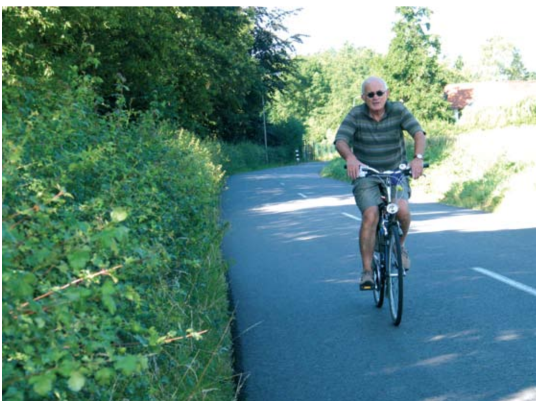
Ter verhoging van de verkeersveiligheid komt in Wolfhagen een voetpad langs de Kakkert.