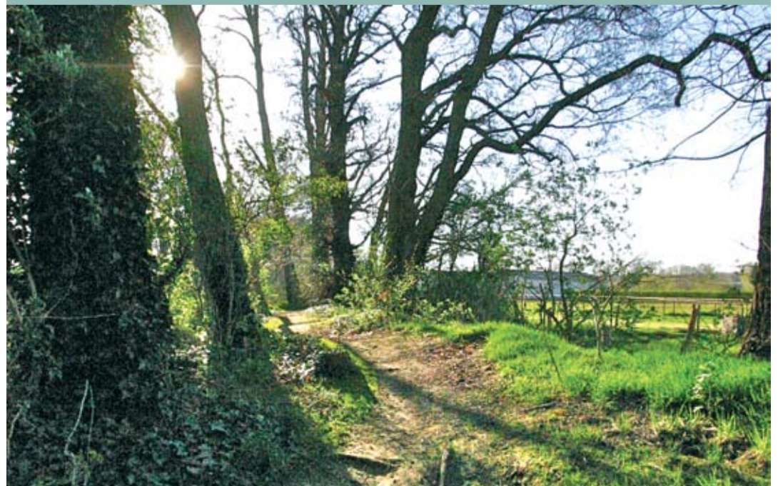
Momenteel is het Urdal-Scharberg erg versnipperd.

Aan de noordkant, tussen het klaverblad Kerensheide en het Van der Valk hotel, ligt het 75 hectare omvattende Heidekamppark. DSM heeft voor de herinrichting een eerste aanzet gegeven. Deze voormalige gipsdeponie moet uitgroeien tot een groen landschapspark met een stedelijke uitlooptfunctie. Om dit te realiseren gaan we de toegankelijkheid aanzienlijk vergroten. Zo komt er een ontsluiting richting campus DSM-Chemelot, een voetgangersbrug nabij het Van der Valk hotel en enkele voetgangersoversteekplaatsen aan de Heidekampweg. Ook zijn er verbindingen gepland met de wijk Kerensheide en het Steinerbos. De inrichting wordt heel gevarieerd. Naast bos komt er ook bloemrijk grasland. Op termijn beschikken we hier over een mooi natuurgebied om te wandelen, mountainbiken, fietsen en paard te rijden. Mogelijk kunnen we hier ook incidenteel evenementen houden.“