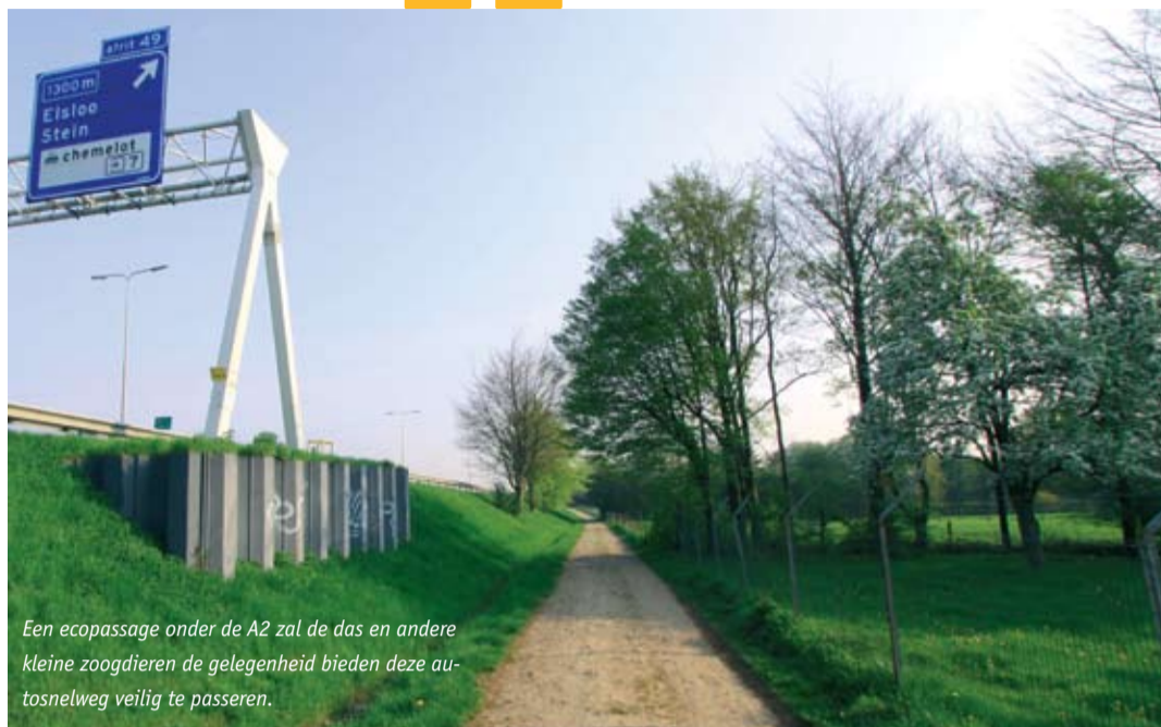
Een ecopassage onder de A2 zal de das en andere kleine zoogdieren de gelegenheid bieden deze autoweg veilig te passeren.

De ecologische verbinding tussen het Geleenbeekdal en de Grensmaas stuit op een aanzienlijk knelpunt ter hoogte van Beek/vliegveld. Om specifieke dieren de Maastrichterlaan en de A2 te kunnen laten passeren