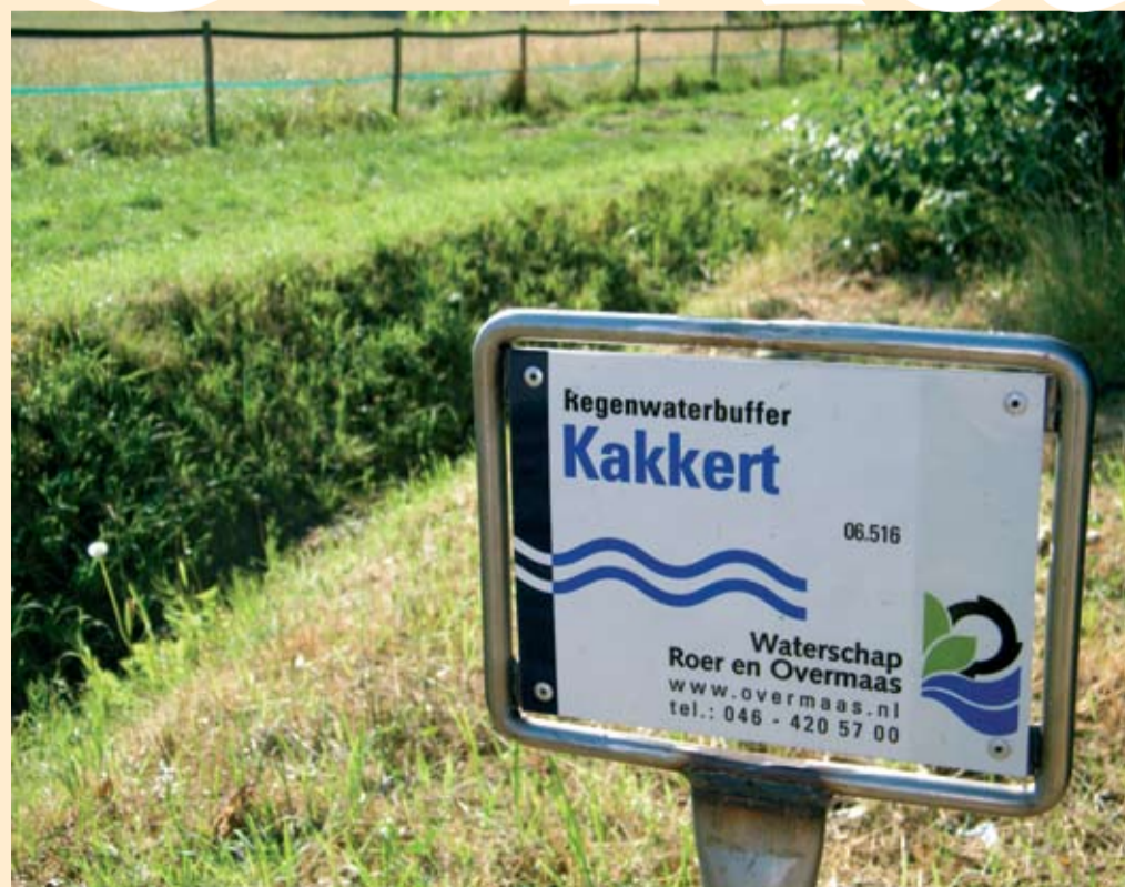
WRO vergroot de capaciteit van de regenwaterbuffer bij de Kakkert met 11.000 m3

De uitvoering van het integrale project de Kakkert en haar directe omgeving vormt de derde fase van het project Beekdalen Schinnen. In het dal krijgt de loop van de Kakkert een natuurlijker aanzien. Naast beekherstel en landschapsverfraaiing wordt ook de recreatieve ontsluiting van het gebied verbeterd. Nieuwe wandelpaden maken een ommetje rond het Schinnense gehucht Wolfhagen mogelijk. Deze wandelpaden sluiten bovendien aan op het uitgebreide wandelpadennetwerk van Landschapspark De Graven.